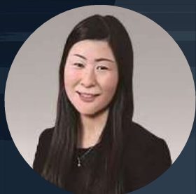
藤田医科大学 言語聴覚士