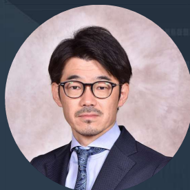
広島国際大学 言語聴覚士