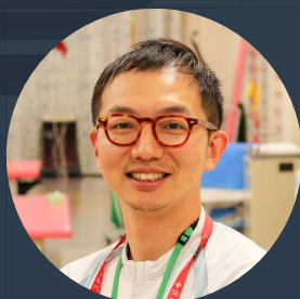
西大和リハビリテーション病院 理学療法士