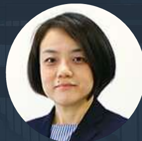
伊藤超短波株式会社 理学療法士